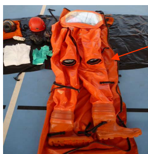
Scaphandre MATISEC DM avec visière panoramique

1 bouteille d'air, 1 détendeur, 1 flexible de 5m, un Casque IMP, un masque avec visière panoramique, une peau de souris avec les sous gants, une paire de gants chimique et une mécanique, 1 masque avec visière panoramique, 1 ARICO MATISEC