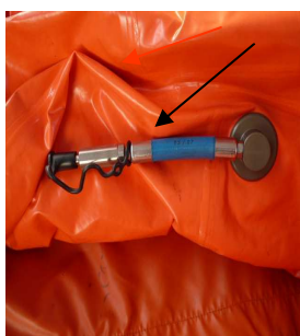
Flexible à raccorder sur le flexible du narguilé Flexible à raccorder sur le dossard