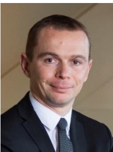
Olivier DUSSOPT Secrétaire d'Etat auprès du Ministre de l'Action et des Comptes publics