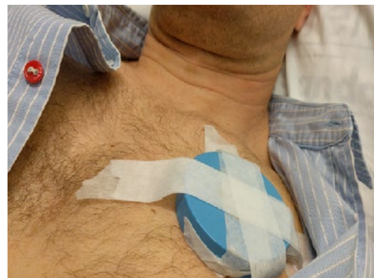
Un aimant est fixé vis-à-vis du DCI.

Il est important de noter que lorsque les chocs d'un DCI sont désactivés, l'appareil fonctionne toujours comme un stimulateur cardiaque. Si vous avez un défibrillateur de TRC, vous recevrez des impulsions pour stimuler votre cœur et aider à atténuer vos symptômes d'insuffisance cardiaque.