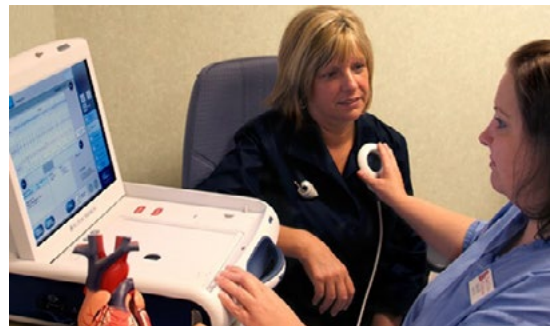
Une clinicienne formée utilise un ordinateur Merlin MC , un dispositif informatique de suivi des malades (PCS). Merlin et St. Jude Medical sont des marques de commerce de St. Jude Medical, Inc. ou de ses sociétés affiliées.

Remarque : L'aimant ne désactive que temporairement le DCI. Ce dernier doit être désactivé à l'aide d'un dispositif informatique, et ce, sans trop attendre, car la pression qu'exerce l'aimant sur la peau peut endommager celle-ci.