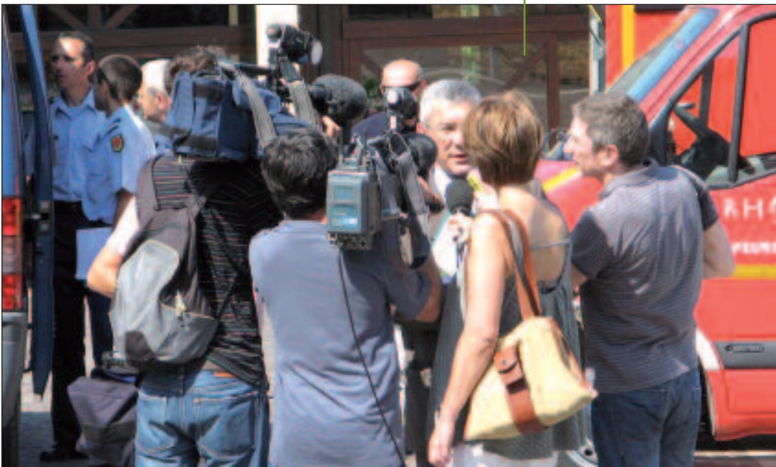
La presse comme observateur

Attention : il faut pouvoir limiter le nombre d'observateurs pour qu'ils ne viennent pas gêner le bon déroulement de l'exercice.