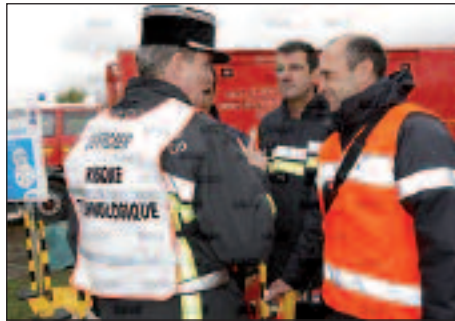
PCO sur le terrain