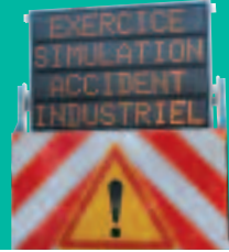
Activation de sirènes lors d'un exercice PPI