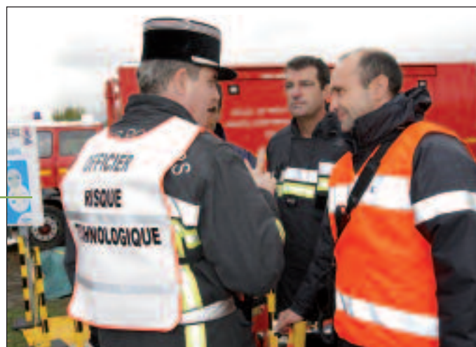
Un Poste de Commandement Opérationnel dans un exercice

Il faut donc prévoir de faire appel à des moyens zonaux, voire nationaux s'il s'agit d'un exercice zonal.