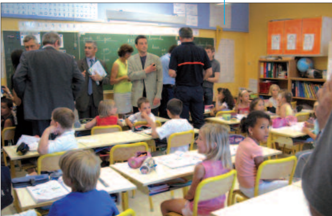
Activation du Plan Particulier de Mise en Sécurité d'une école pendant un exercice

L'idéal est de passer progressivement de l'exercice clairement annoncé et dont la plupart des éléments sont connus à l'exercice où seule la date sera arrêtée, et éventuellement aussi la zone géographique concernée. Il faut donc une certaine progression pédagogique qui donne de plus en plus de marge à l'initiative et à la connaissance individuelle.