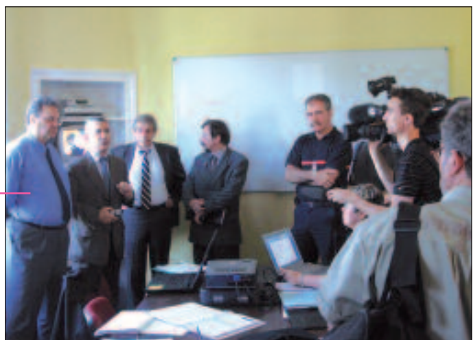
Présentation d'un exercice devant les médias

La planification des exercices cadre est plus simple et peut être reproduite dans ses grandes lignes d'un exercice à l'autre ce qui n'est pas le cas de l'exercice terrain avec participation de la population.