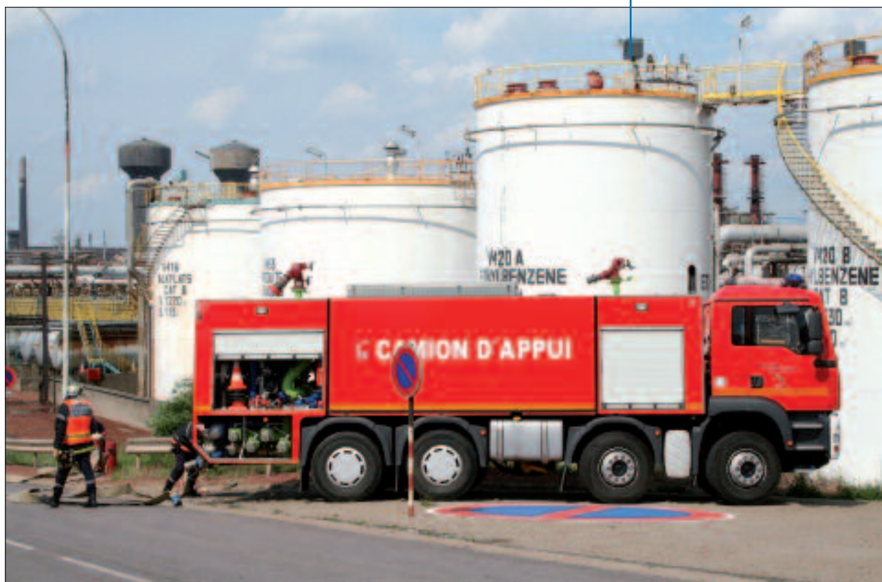
Exercice PPI sur site industriel