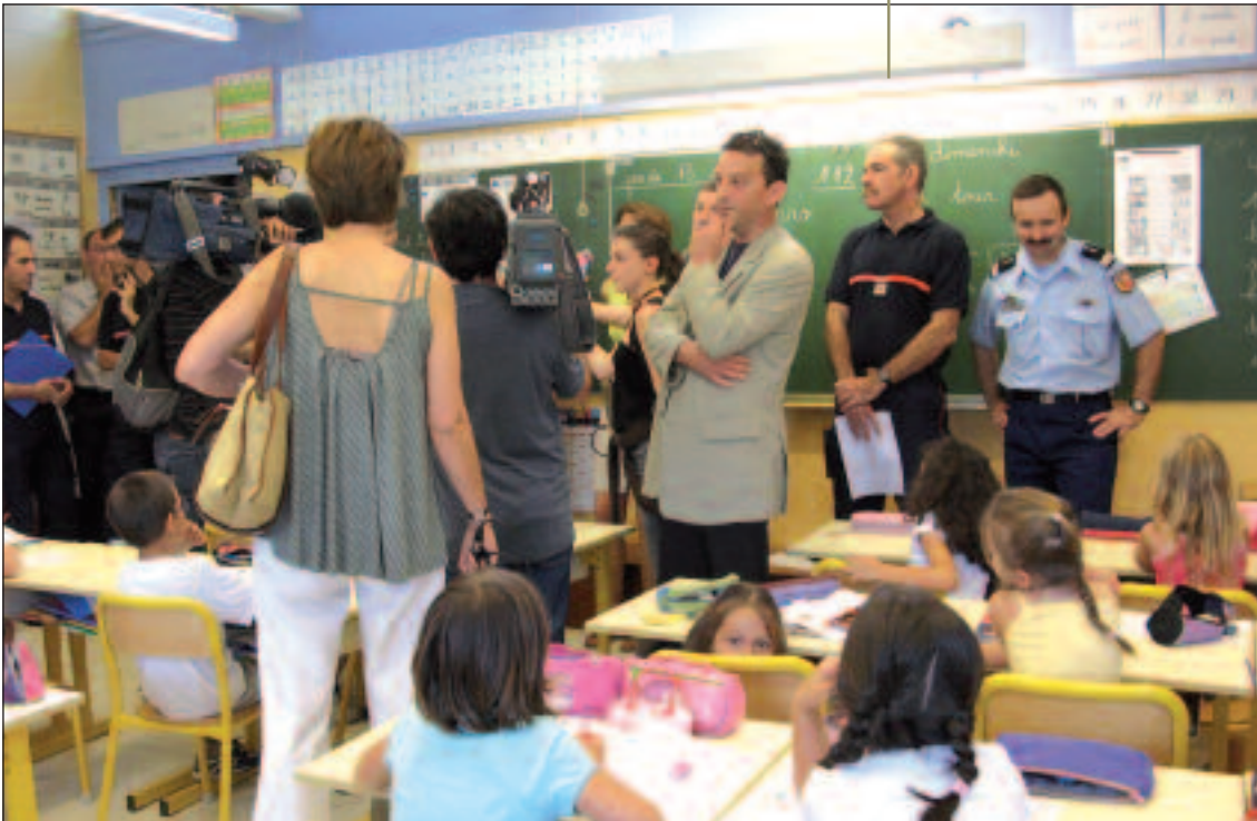
Mise en œuvre du Plan Particulier de Mise en Sécurité dans une école pendant un exercice PPI