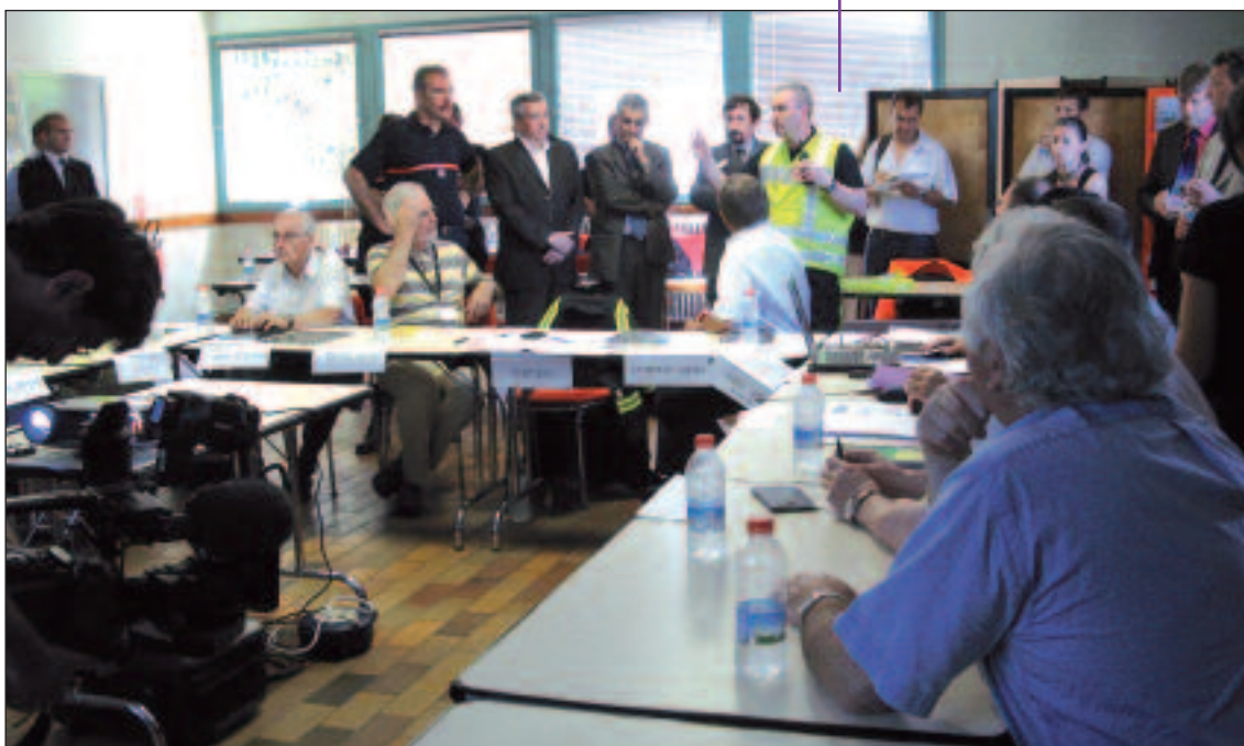
REX à chaud

Tout échange sur l'exercice après ce bilan à chaud, devra être pris en compte dans le processus d'analyse du retour d'expérience.