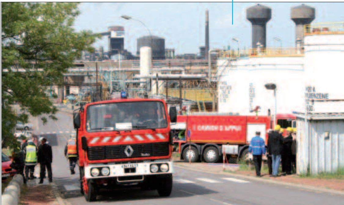
Fourgon de production de mousse