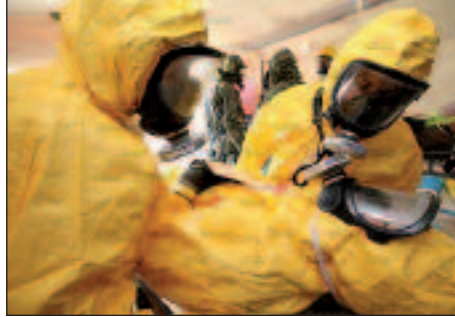
Action sur le terrain