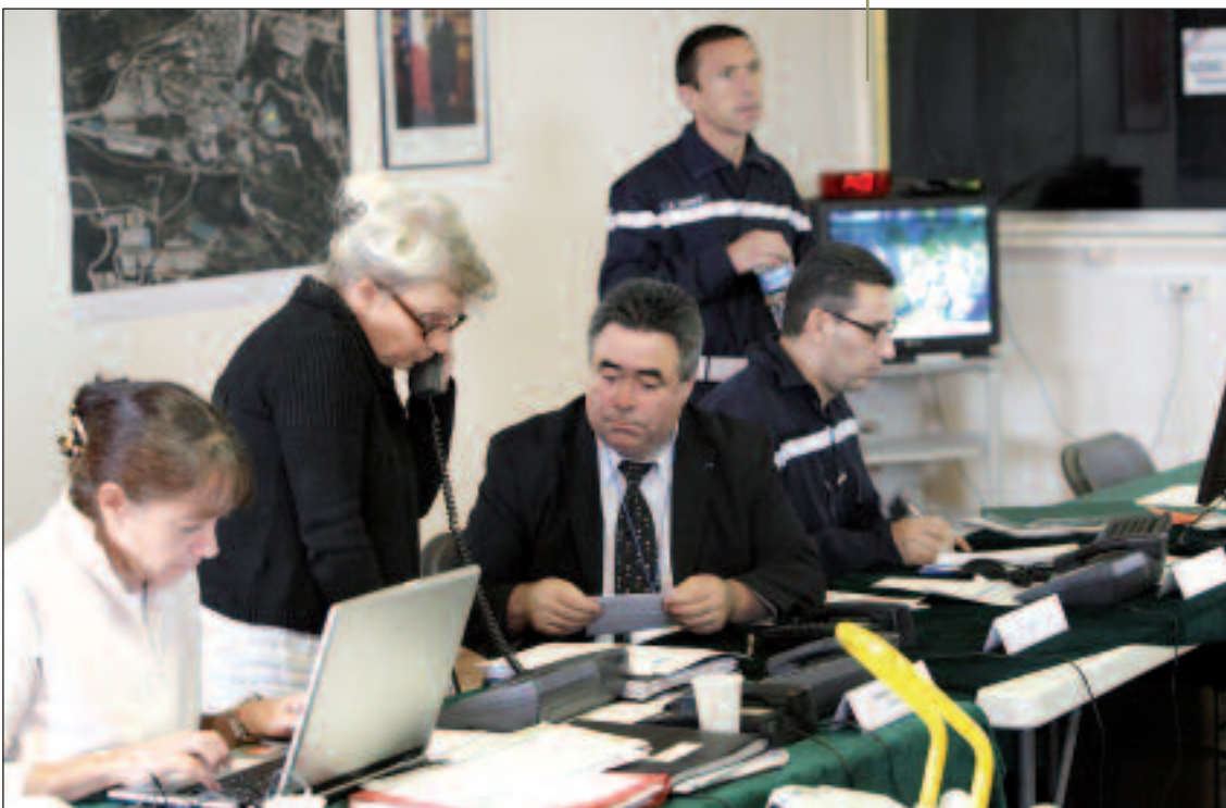
PCO - Un Poste de Commandement Opérationnel en salle