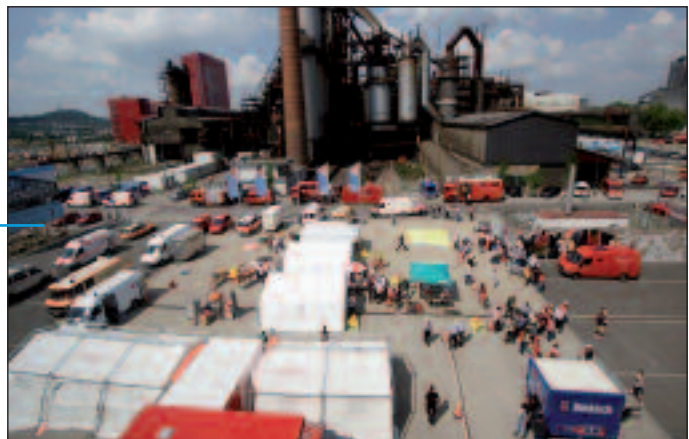
Un Poste de Commandement Opérationnel déployé dans une zone industrielle