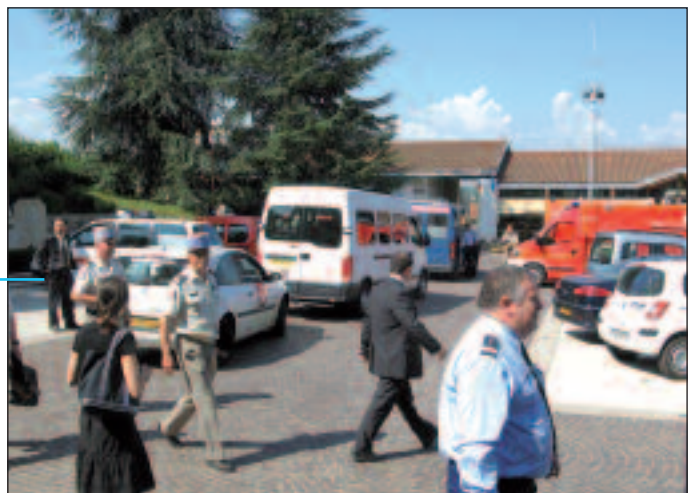
Poste de Commandement Opérationnel réalisé en extérieur avec plusieurs véhicules postes de commandements

Au niveau départemental, le PPI prévoit généralement la mise en place d'un Poste de Commandement Opérationnel (PCO) . Il doit apparaître dans les exercices. Même si la cinétique extrêmement rapide de ceux-ci ne permet pas matériellement de le mettre en œuvre, son activation, même fictive, doit être prise en compte pour la crédibilité du scénario. Cela peut se traduire par le départ de certains cadres présents au COD, qui seraient censés le rejoindre. Son activation soulève des problèmes qu'il convient d'étudier. Il est très important aussi d' associer les communes impactées par le site SEVESO pour leur faire jouer leur Plan Communal de Sauvegarde (PCS) . Si celui-ci n'est toujours pas réalisé, le maire peut être invité comme observateur ou jouer "en l'état" avec les moyens et les procédures dont il dispose, afin qu'il comprenne l'implication qui doit être la sienne dans ce type d'événement. L'expérience montre qu'un exercice - dès sa préparation - est un puissant encouragement à réaliser le PCS !